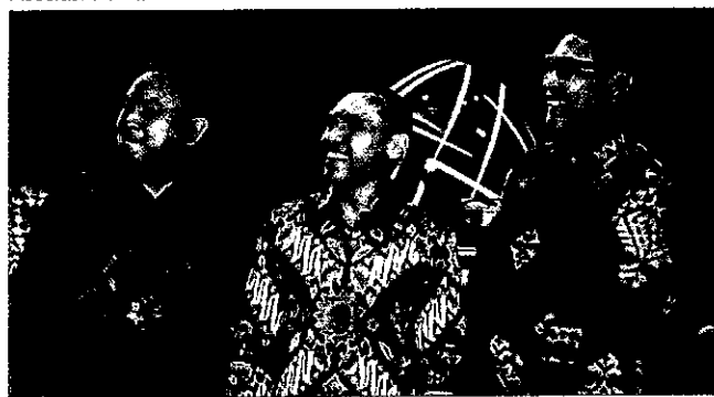
Dari kiri: Kepala Eksekutif Pengawas Pasar Modal OJK Hoesten, Ketua Asosiasi Penasehat Investasi Indonesia (APII) Adi Adji dan Direktur Utama Bursa Efek Indonesia (BEI) Inarno Djajadi saat peresmian Asosiasi Penasehat Investasi Indonesia (APII) di Bursa Efek Indonesia, Jakarta (26/3). Dukung oleh KSEI, pendirian APII diharapkan mampu mempercepat pertumbuhan investor baru serta menjadi sarana edukasi bagi masyarakat tentang investasi.