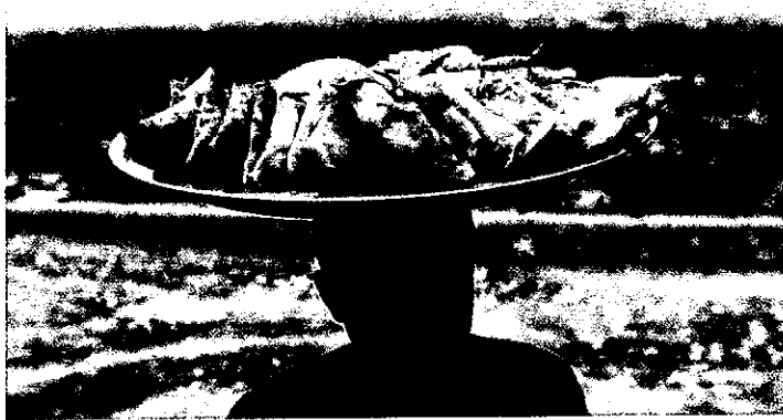
Berjualan Samosa Seorang pedagang samosa berjualan di daerah perbukitan Wazir Akbar Khan dengan latar belakang Kabul, ibu kota Afghanistan, pada Selasa (26/3).